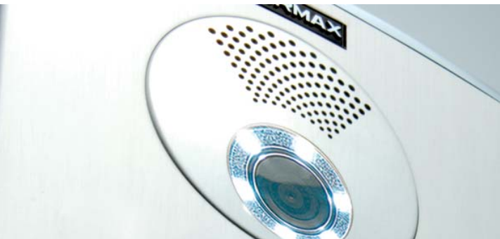
Cámara Color CCD con iluminación

La cámara transmite una imagen de alta resolución.