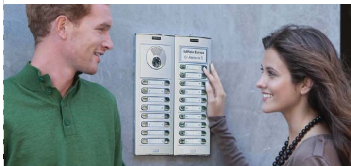
Placas Cityline y Skyline

Es toda metálica, salvo en las zonas transparentes. Incorpora protección frente a los rayos ultravioleta. No amarillea.